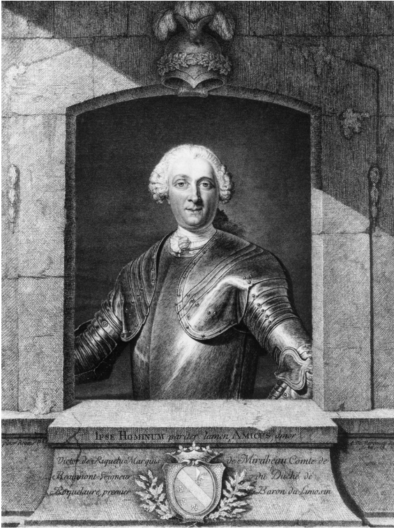
Victor de Riqueti, Marquis de Mirabeau

großen literarischen Fähigkeiten seines Briefpartners erkannt hatte und diesen wiederholt dazu ermunterte, ein großes Werk zu schreiben.