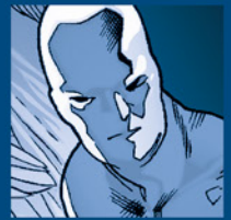
ICEMAN BOBBY DRAKE