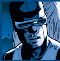
CYCLOPS SCOTT SUMMERS