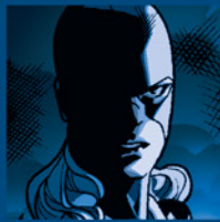
MARVEL GIRL JEAN GREY