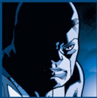
BEAST HANK MCCOY