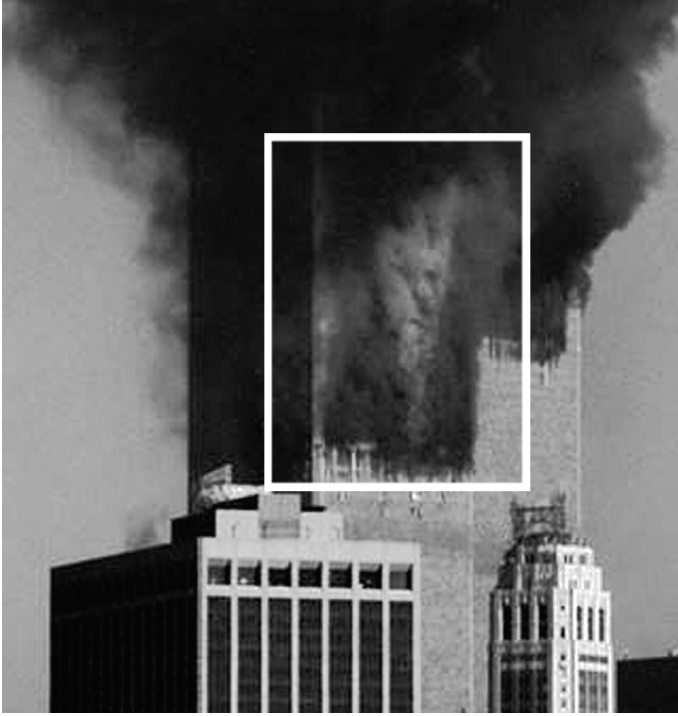
Die in der Folge von 9/11 verbreitete Antichrist-Fratze über Manhattan.

Krieges», zog während des Laubhüttenfests ein anderer Mann von schlichter Herkunft laut rufend durch die Straßen Jerusalems, Jesus, der Sohn eines gewissen Ananias: Wehe über Jerusalem und den Tempel, [...] wehe über das ganze Volk . Die Leute blieben stehen, hörten ihm zu, verwunderten sich. Sieben Jahre wiederholte er seine Weherufe. Der römische Statthalter hielt den Mann für verrückt. Doch der größte Geschichtsschreiber seines Volkes, Flavius Josephus, hielt seine Ekstase für alle Zeit fest. Himmelszeichen wie der Halleysche Komet zeigten die Katastrophe an (66 CE). Da, vier Jahre nach seinem ersten Ruf, begann der Krieg gegen die Römer, und noch einmal vier Jahre später waren Stadt und Tempel zerstört (70 CE). Die Apokalypse war Wirklichkeit geworden, eingebrannt in das Gedächtnis von Juden und frühen Christen. 1