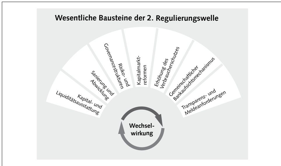
Abb. 1: Wechselwirkung (eigene Darstellung)

Zwar ist die Krise noch nicht gänzlich ausgestanden und auch die Ursachenforschung noch nicht abgeschlossen, allerdings wurden bereits einige Schlüsse gezogen. Eine maßgebliche Lehre aus der Krise war die Erkenntnis der Notwendigkeit einer globalen, einheitlichen und abgestimmten Finanzmarktregulierung. Im September 2009 fassten die Vertreter der G20-Staaten zusammen mit Vertretern der EU in Pittsburgh den Beschluss, die Transparenz, Stabilität und Zuverlässigkeit der Finanzmärkte zu stärken. Der europäische Gesetzgeber erließ als Reaktion auf die Krise eine Reihe von Verordnungen und Richtlinien. Triebfeder war, die Effizienz, Stabilität und Transparenz an den Finanzmärkten zu steigern und das Vertrauen in die Märkte wieder zu stärken.