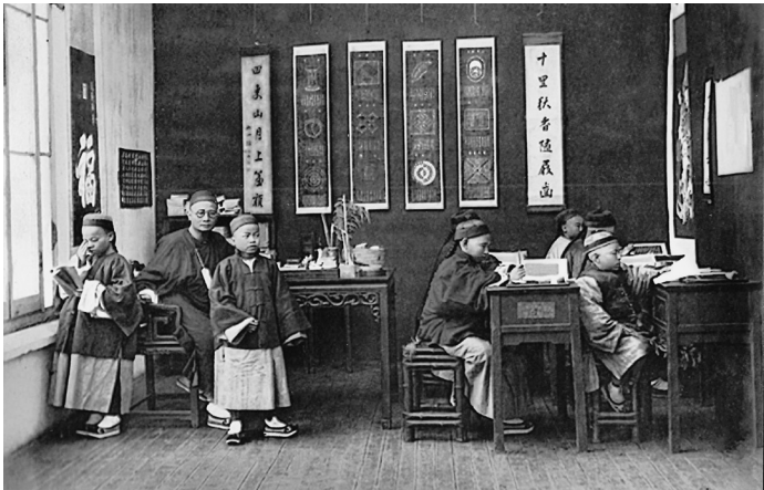
Unterricht in Kanton im ausgehenden 19. Jahrhundert. Die Aufnahme zeigt Schüler aus der begüterten Oberschicht mit ihrem Lehrer.