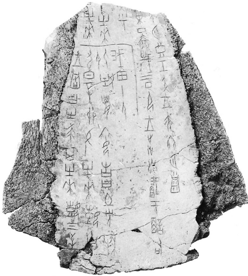
Auf einem Rinderknochen dokumentierte Befragung des Orakels aus Anyang (Henan), 13. Jahrhundert v. Chr.

In Wirklichkeit waren die beiden Gelehrten indes Antiquitätensammler, die ihre Bestände, die sich bis dahin primär aus Steinobjekten, Bronzegefäßen und alten Büchern zusammensetzten, neuerdings durch beschriftete Knochen ergänzten. Diese erwarben sie von Händlern, die sie wiederum Bauern aus der Umgebung von Anyang (Provinz Henan) abgekauft hatten, einer Stadt, in deren Nordwesten einst der letzte Herrschersitz der Shang-Dynastie gelegen hatte.