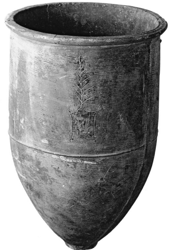
Tontopf mit eingeritztem Emblem aus Juxian (Shandong), 3. Jahrtausend v. Chr.

Nichts spricht hingegen für die syntaktisch korrekte Umset-