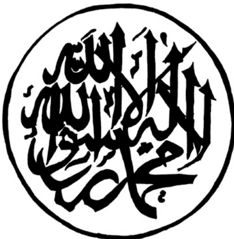
Abbildung 1: Kunstvolle Kalligrafie des islamischen Glaubensbekenntnisses